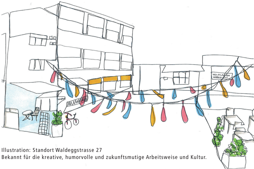
Illustration: Standort Waldeggstrasse 27 Bekannt für die kreative, humorvolle und zukunftsmutige Arbeitsweise und Kultur.

Jeder Mensch bringt seine eigene Geschichte mit in den Drahtesel. Gemeinsam kreieren wir Zukunftsmut.